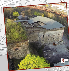
3. Feste Kaiser Franz