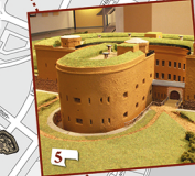
FESTUNGSSYSTEM „Festung Koblenz und Ehrenbreitstein“ Erhaltene und zerstörte Festungsteile