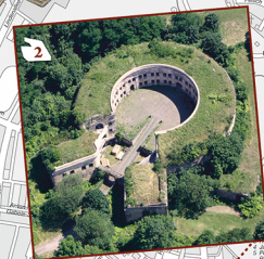
2. Fort Asterstein