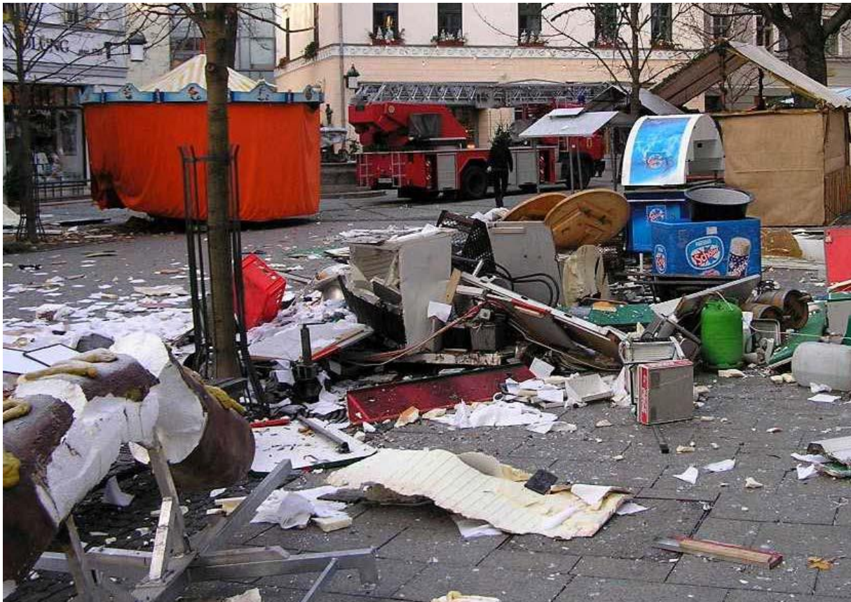
Abbildung: Auswirkungen einer Explosion eines Imbisswagens infolge einer undichten Flüssiggasanlage am 26.11.2004 auf dem Weihnachtsmarkt Weimar